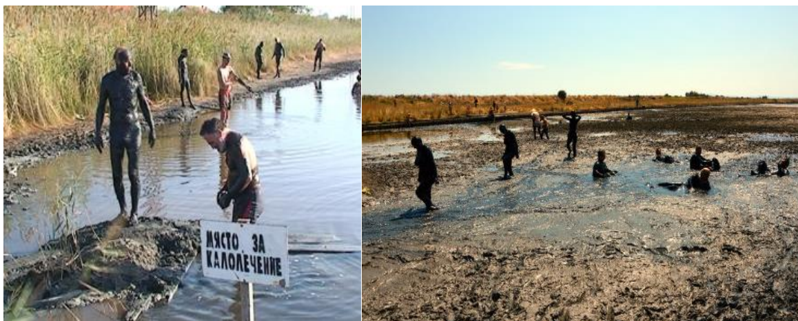
В лечебната кал във всеки един момент през лятото има по 40-50 души.