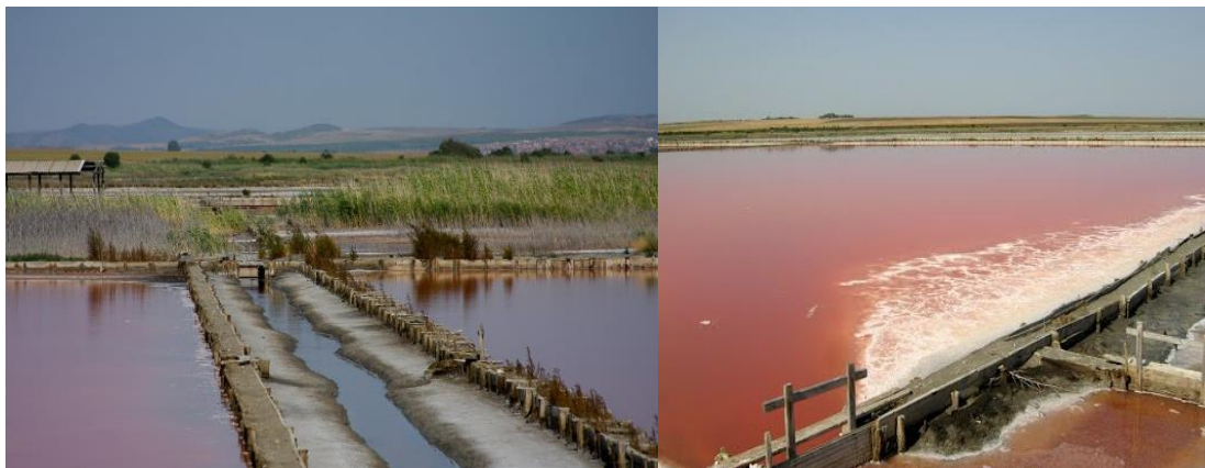
Лугата се получава от морската вода при слънчево изпарение. Солевото съдържание на лугата е около 350г на литър.